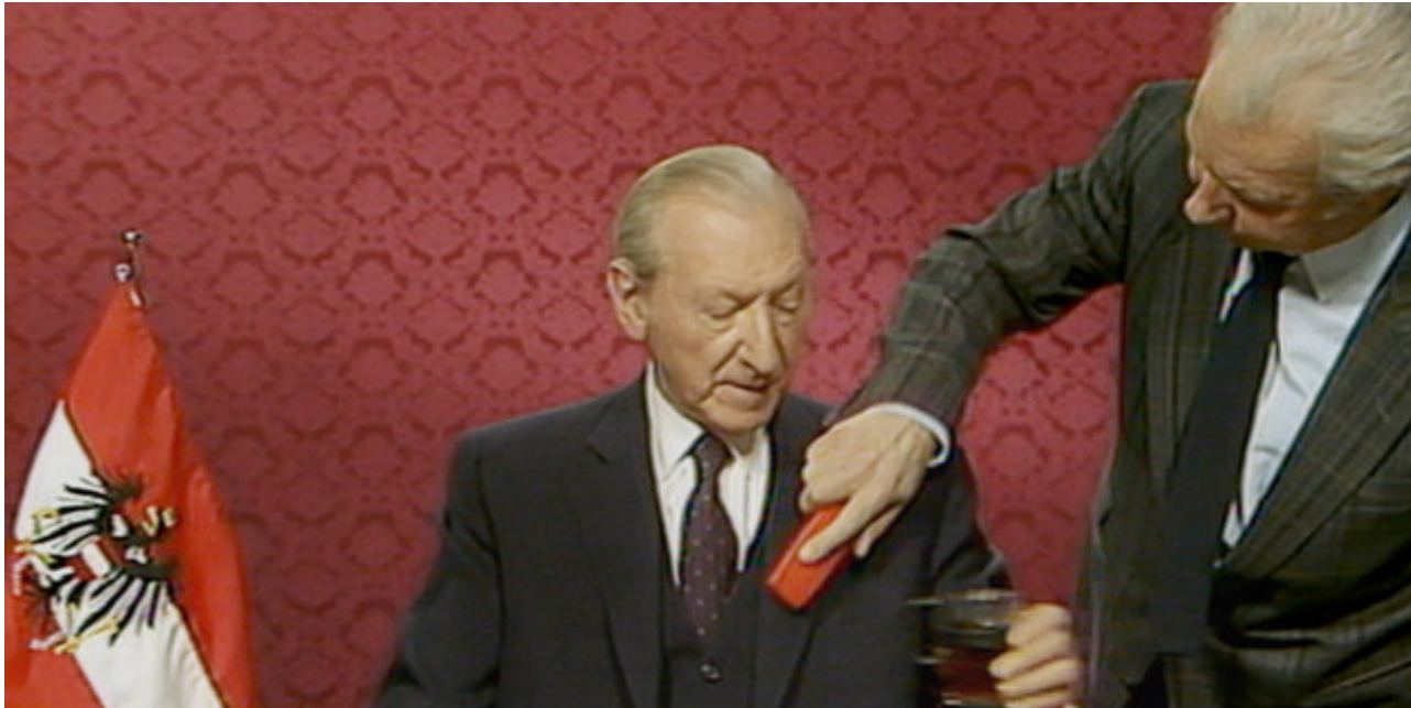
Hier kommt Kurt

Ruth Beckermanns Doku „Waldheims Walzer“ zeigt, wie die gesellschaftliche Mitte in Österreich die Abgrenzung zum Nationalsozialismus aufgab.