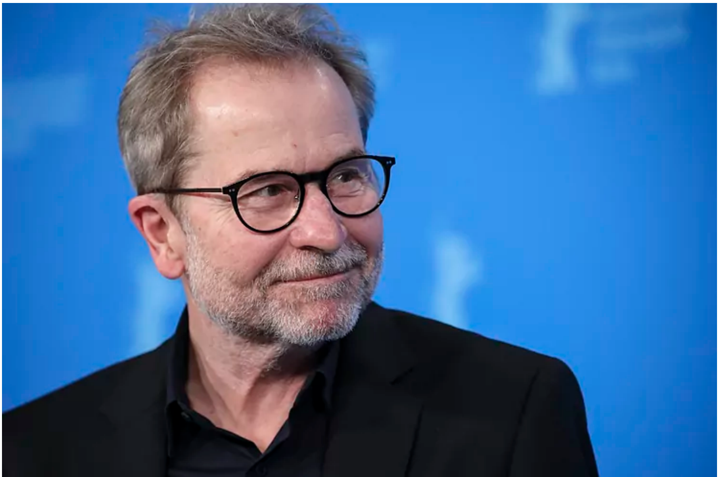
El director austriaco Ulrich Sedil.

Cuando se dio a conocer todo, las reacciones no tardaron. El Festival de Toronto, donde estaba también programa la cinta, decidió sacarla de la programación hasta que no se aclarase el asunto. San Sebastián, sin embargo, insistió en la misma argumentación del año pasado cuando se le colocó en la picota por entregar el Premio Donostia a Johnny Deep , entonces condenado por un tribunal de Londres, y luego absuelto por otro en Estados Unidos, por abusar de su exmujer. Excusa de San Sebastián: la presunción de inocencia. Acto seguido, Ulrich Seidl hizo pública su intención de no asistir a la capital guipuzcoana con el argumento de que la obra, su película, hable por sí misma.